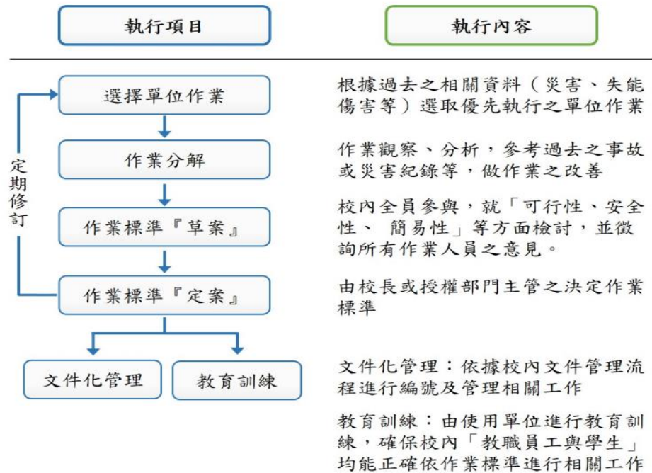
圖一、安全作業標準製作步驟